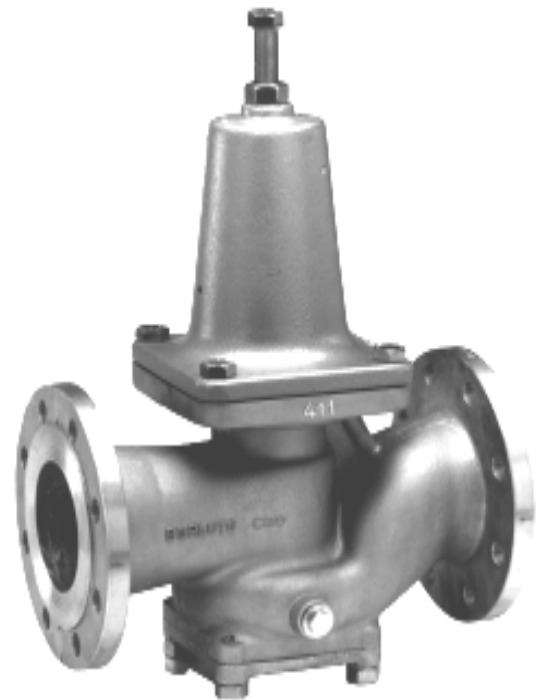
DN 80 bis DN 100