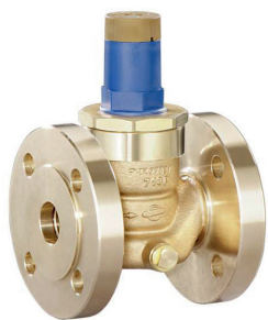
DRV 550 Bauform A (DN 15 - DN 32)