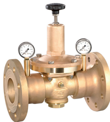
DRV 550 Bauform B (DN 40 - DN 80)